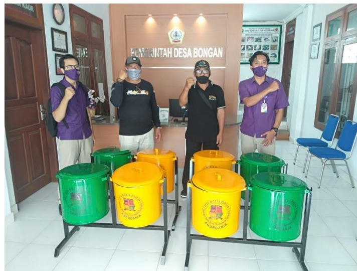
Gambar 4. Penyerahan tempat sampah organik dan anorganik di Kantor Desa Bongan (Dokumentasi PIB, 2020)

Desa Bongan mengalami kemajuan dalam penerapan CHSE setelah diadakan sosialisasi mengenai pentingnya CHSE dan pendampingan mengenai penerapan CHSE misalnya dengan menyediakan tempat cuci tangan di setiap daya tarik wisata, himbauan penggunaan masker dan jaga jarak. Bentuk dukungan lainnya yang diberikan oleh Politeknik Internasional Bali adalah pemberian tempat sampah organik dan anorganik sebagai salah satu indikator dari penerapan CHSE. Pemberian tempat sampah organik dan anorganik ini memiliki tujuan agar masyarakat desa Bongan dapat dengan semangat menjaga kebersihan lingkungan serta dapat dilaksanakan secara berkelanjutan. Tempat sampah organik dan anorganik yang diberikan oleh Politeknik Internasional Bali ditempatkan pada setiap daya tarik wisata yang dimiliki oleh desa Bongan mengingat desa Bongan memiliki beberapa daya tarik wisata di dalamnya sehingga kebersihan di setiap daya tarik wisata tersebut akan terjaga dengan baik.