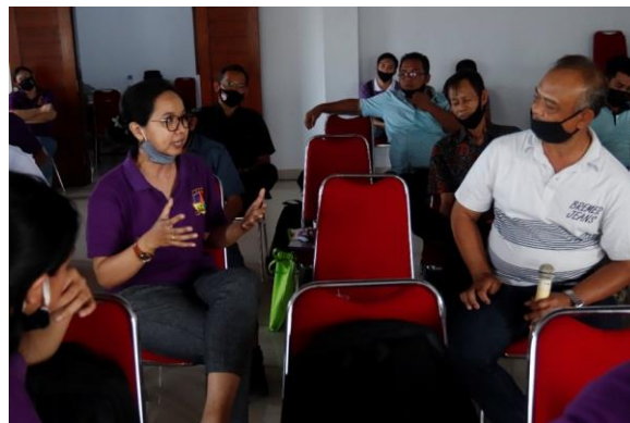
Gambar 3. Kegiatan Pelatihan

Setelah sosialisasi dilanjutkan dengan kegiatan pelatihan. Dosen Politeknik internasional Bali menyiapkan materi pelatihan pada bulan Agustus-September 2020. Pelaksanaan pelatihan dilakukan mulai bulan Oktober sampai Desember 2020 secara bertahap, sehingga selalu diadakan monitoring dan evaluasi secara berkala dan berkelanjutan agar dapat mencapai tujuan seperti yang diharapkan serta memperoleh hasil yang maksimal. Monitoring , evaluasi dan coaching dilakukan oleh seluruh dosen Politeknik Internasional Bali yang terlibat dalam pendampingan pengembangan desa Bongan sebagai desa wisata. Monitoring dan evaluasi yang dilakukan tertuang dalam bentuk pengawasan serta arahan jika pelaksanaan dilapangan menunjukkan sesuatu hal yang berbeda dari yang seharusnya. Hasil dari kegiatan pendampingan yang terdiri dari sosialisasi, pelatihan, monitoring dan evaluasi diuraikan sebagai berikut: