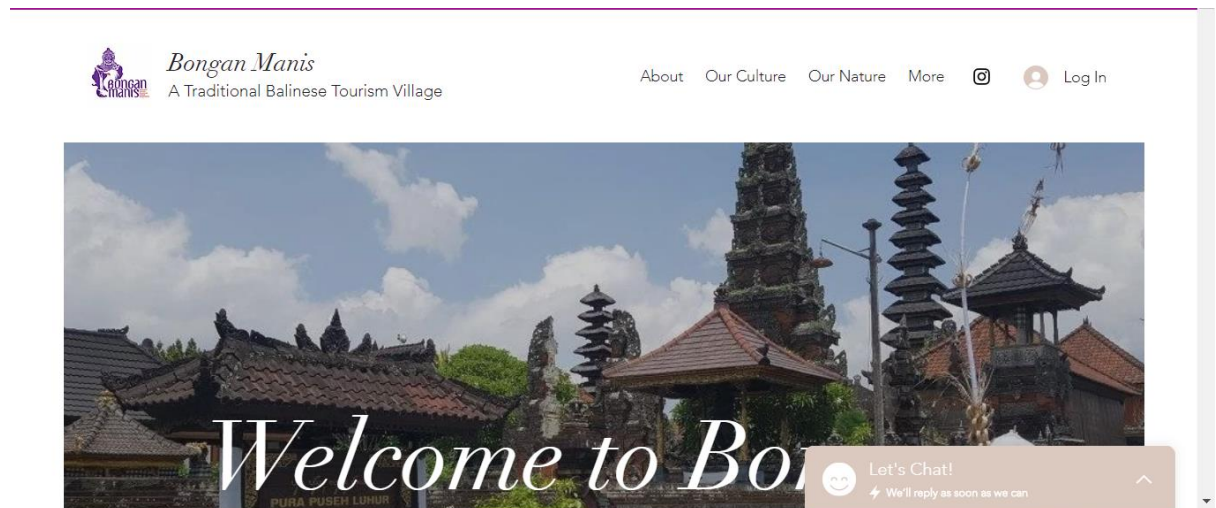
Gambar 5. Website Bongan Manis

Selama kurang lebih dua bulan melakukan pendampingan mengenai pemasaran digital terlihat adanya perkembangan desa wisata pasca pendampingan. Desa wisata Bongan sudah memiliki Logo dengan filosofi icon: Jalak Bali, Patung Kebo Iwa, dan Air Terjun Grembengan. Logo adalah trademark yang penting bagi sebuah desa wisata dalam melakukan branding . Desa Wisata juga telah memiliki akun sosial media Instagram, Facebook, dan Youtube