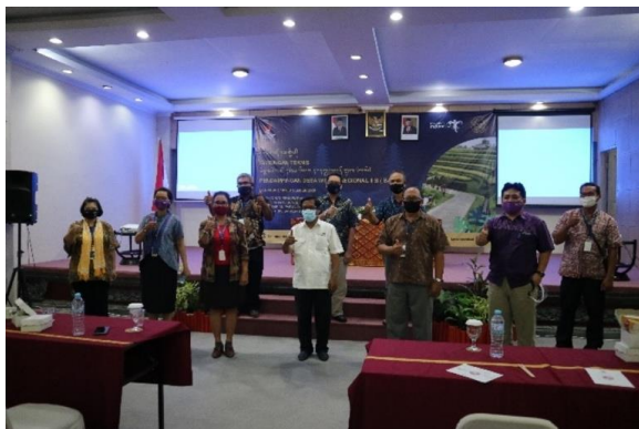
Gambar 2. Kegiatan Sosialisasi