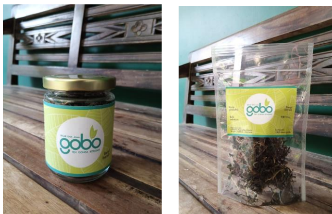
Gambar 7. Hasil Pendampingan pengemasan produk unggulan the Gobo

Dalam program pelatihan ini pendamping dan masyarakat saling berdiskusi untuk menyusun value proposition , tagline , pokok-pokok desain logo dan label, serta pengemasan. Monitoring, Evaluasi, dan Coaching dilaksanakan secara langsung pada setiap jadwal kunjungan, monitoring , evaluasi dan coaching mayoritas dilaksanakan secara daring dengan metode bimbingan one-on-one dengan perwakilan masyarakat yang langsung bertanggungjawab terhadap perancangan kemasan dan branding teh Gobo. Setelah adanya program pendampingan, teh Gobo yang tadinya belum berupa produk dan hanya disajikan secara gratis kepada pengunjung obyek wisata Grembengan, sekarang sudah dapat menjadi suatu produk yang dapat dipasarkan dan berdaya jual.