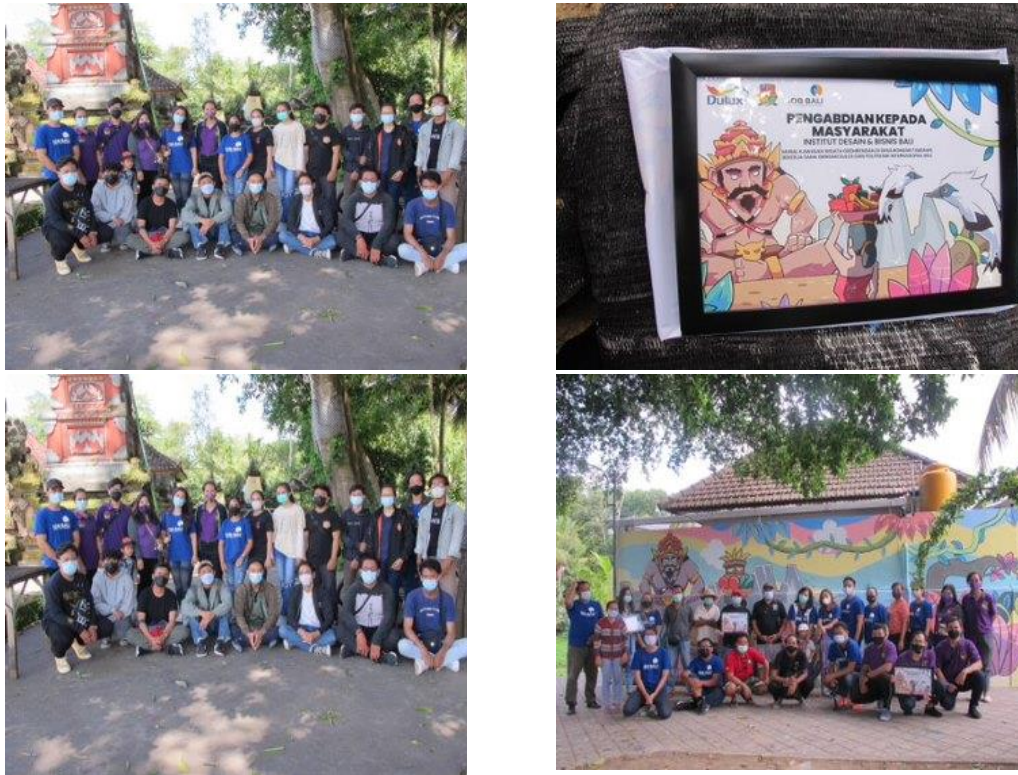
Gambar 6. Foto Bersama dengan Seluruh Tim PkM (Dokumentasi, 2020)

Tahap Finishing merupakan tahap terakhir yaitu tahap merapikan cat dan membersihkan sekitar mural. Penambahan gradasi dan penyempurnaan warna.