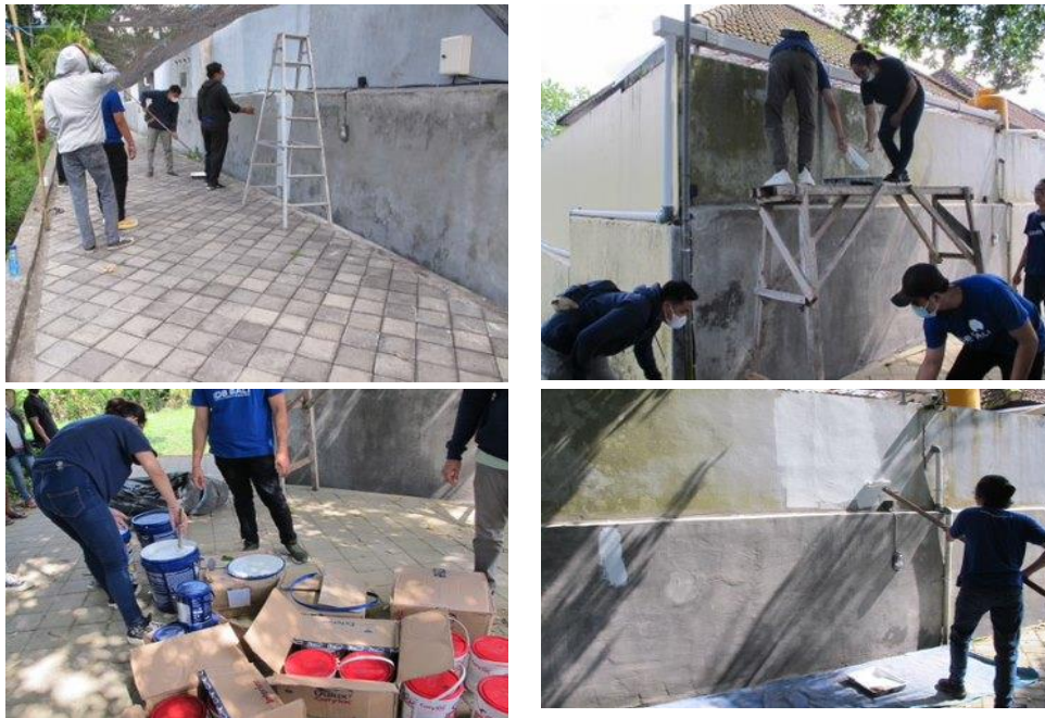
Gambar 3. Tahap Persiapan Membuat Mural (Dokumentasi pribadi,2020)

Tahap berikutnya adalah penggambaran pola di dinding, selanjutnya mulai melakukan pengecatan tembok, secara bertahap, sesuai dengan pola gambar dan warna yang sudah dibuat. Membuat lukisan mural dimulai dari bagian latar, setelah itu dilanjutkan dengan objek depan.