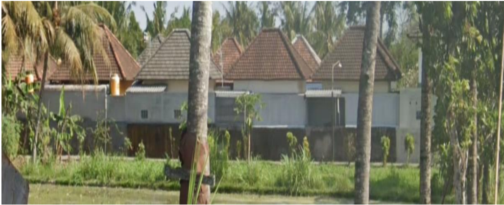
Gambar 2. Dinding Sebelum di Mural (Dokumentasi,2020)