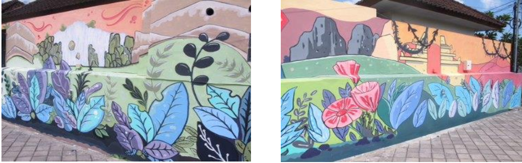
Gambar 4. Tahap Melukis Mural (Tahap Cat Awal/Latar) (Dokumentasi,2022)