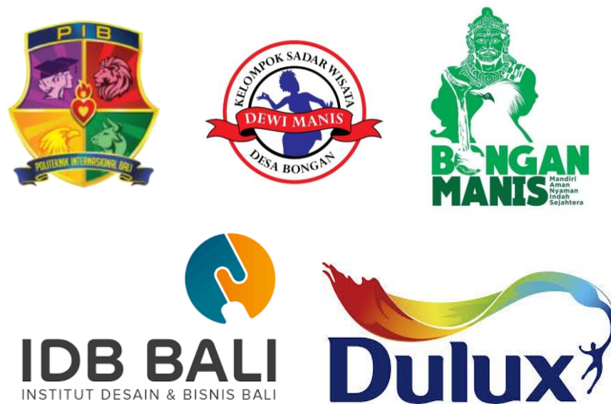
Gambar 1. Logo Instansi

Program Pengabdian Masyarakat ini dilakukan untuk memberikan edukasi kepada masyarakat sekitar DTW sehingga kedepannya terjadi peningkatan kualitas tempat wisata. Kegiatan diawali dengan pemberian materi mengenai pengetahuan umum tentang seni mural dan potensinya, serta fungsinya sebagai unsur estetika memperindah bangunan dan Kawasan. Peserta juga diberikan motivasi untuk mempelajari pembuatan mural dan manfaat yang didapat dari kegiatan yang telah dilakukan. Pemahaman peserta pelatihan yang hadir dapat diukur dengan proses tanya jawab. Setelah perkenalan, kegiatan dilanjutkan dengan memperkenalkan alat dan bahan yang akan digunakan pada kegiatan ini. Selanjutnya dilakukan demonstrasi proses pembuatan mural pada dinding yang telah ditentukan.