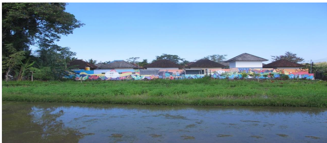
Gambar 7. Hasil Akhir Pembuatan Mural (Dokumentasi, 2020)

Berdasarkan hasil dan pembahasan, dapat disimpulkan bahwa kegiatan pengabdian berupa pembuatan mural pada DTW Gerembengan Desa Bongan memberikan dampak positif bagi masyarakat desa Bongan. Salah satunya yaitu menambah keindahan dan daya tarik di gerembengan desa Bongan. Mural ini